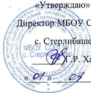
ГРАФИК РАБОТЫ СПОРТИВНЫХ СЕКЦИЙ ШСК «СПАРТАК»